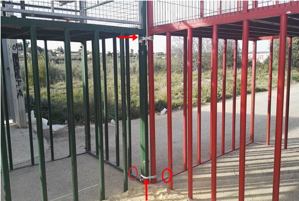
Ejemplo de anclaje de cadafales en esquina: al suelo (con tornillos expansivos) y entre sí (con cuerda).

Los cadafales, también denominados plataformas para el público, son estructuras metálicas, con al menos una barrera vertical recayente al ámbito del festejo taurino, escalera y plataforma superior destinada para los espectadores. Por todo ello, su masa (peso) suele ser elevada , especialmente cuando se encuentran cargados por espectadores en su plataforma superior. A pesar de ello, el Reglamento de Bous al Carrer tiene la cautela de prescribir su anclaje , al objeto de evitar fugas de las reses del ámbito del festejo o desplazamientos en los cadafales que pudieran lesionar a espectadores y/o participantes por causa de la embestida de las reses.