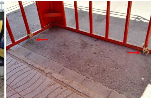
Anclajes con tornillos expansivos.